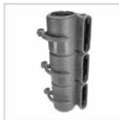
最大 5 台 積み重ね可能 (画像は 3 台積み重ね時)