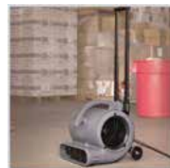
延長ハンドルと 車輪付きで移動がラク