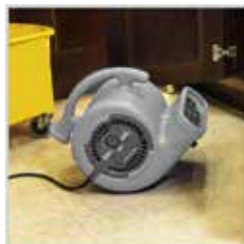
3 つの風の角度 0 度, 45 度, 90 度