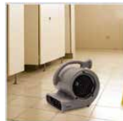
静音設計 高速モードで 74dB