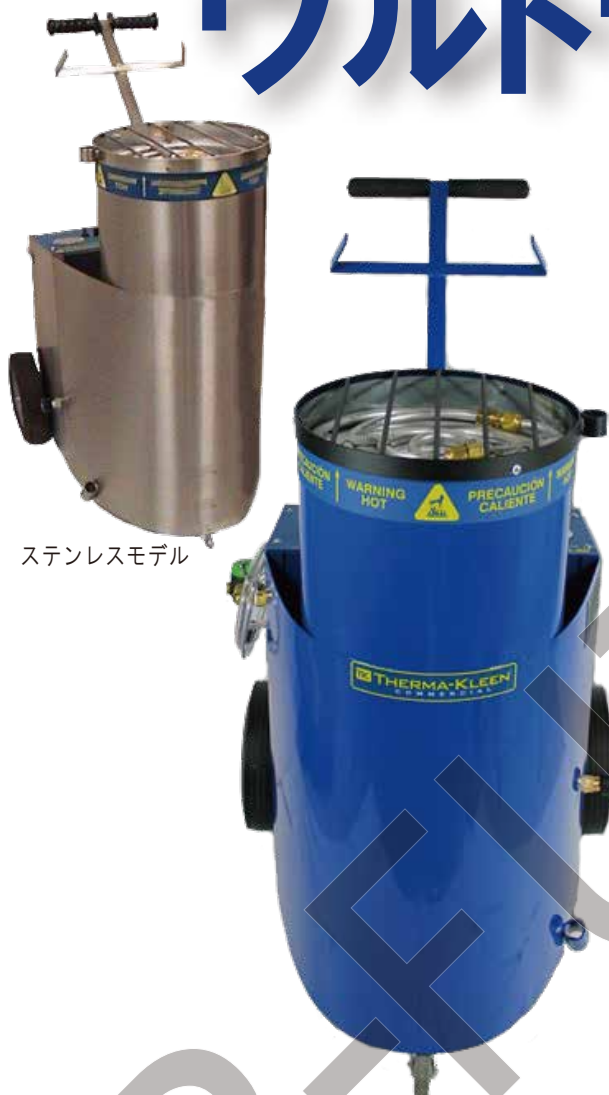
ステンレスモデル